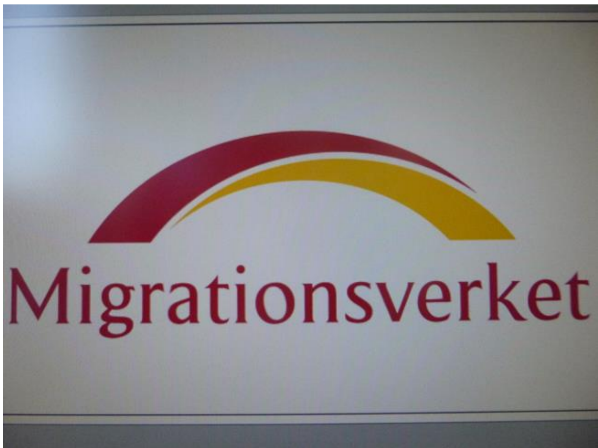
Bild 1: "Varje gång jag går till Migrationsverket blir jag arg och ledsen" - Katarina 9 år