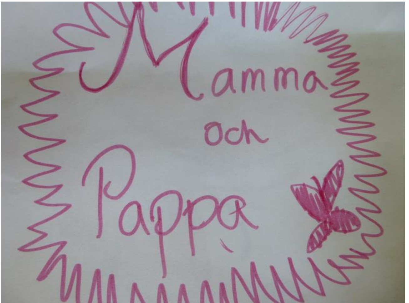
Bild 7: "Mamma och pappa gör mig glad. När jag är orolig säger de att vi löser allting." - Fia 11 år