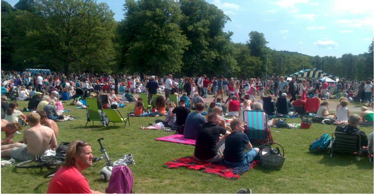
Bild 5: "Om jag är med svenskar som har pengar och så, känner jag att jag är annorlunda, eftersom jag inte kan köpa nya grejer och så" - Liam 13 år