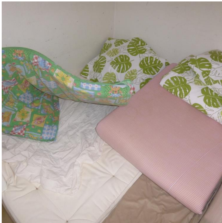
Bild 4: "Mitt rum är en klädgarderob som jag delar med min bror" - Mehmed 15 år